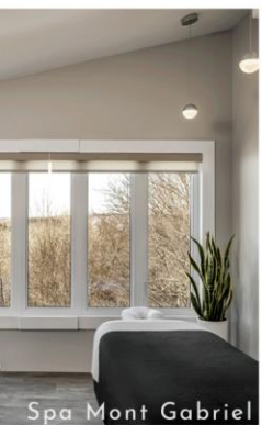
Spa Mont Gabriel